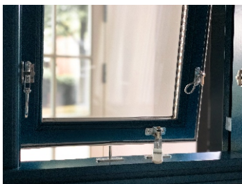
TOPGEHÄNGTES OBERLICHT MIT AUSSTELLSTANGE UND ANWERFERN

www.fecon-nordwest.de info@fecon-nordwest.de