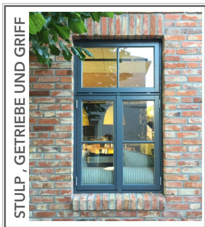
STULP, GETRIEBE UND GRIFF