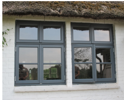
STULSPROSSE IM OBERLICHT