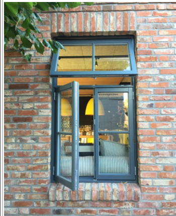
TOPGEHÄNGTES OBERLICHT MIT GETRIEBE UND GRIFF

FECON Nordwest Marke der TTH GmbH & Co. KG