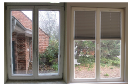
Standard: asymmetrische Ansicht